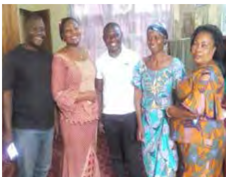
Voix Libres - Afia-Fev, Congo Kivu