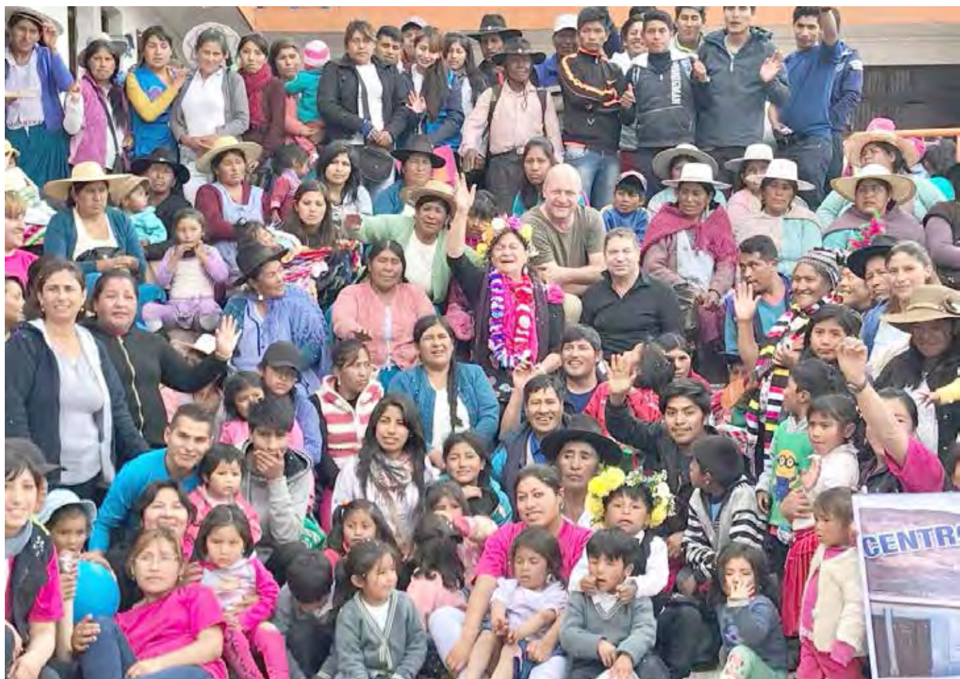
25 novembre 2017, l'équipe pluridisciplinaire de Voix Libres à Potosí constituée par les enfants que nous avons bercés !