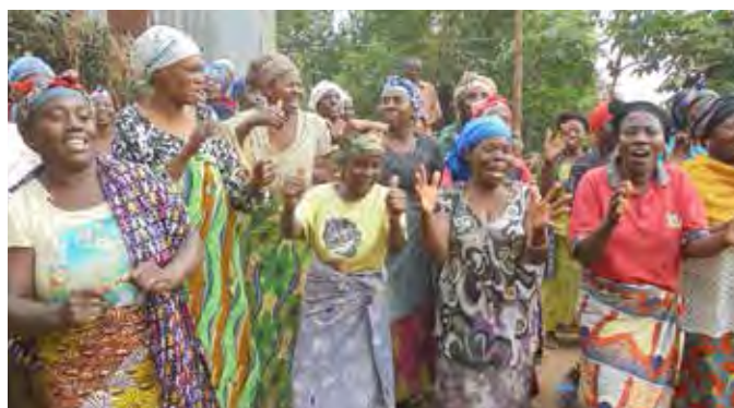
Le chant après les micro-crédits!