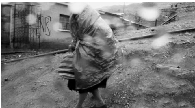
Avant... à Potosi, 4'200 mètres...