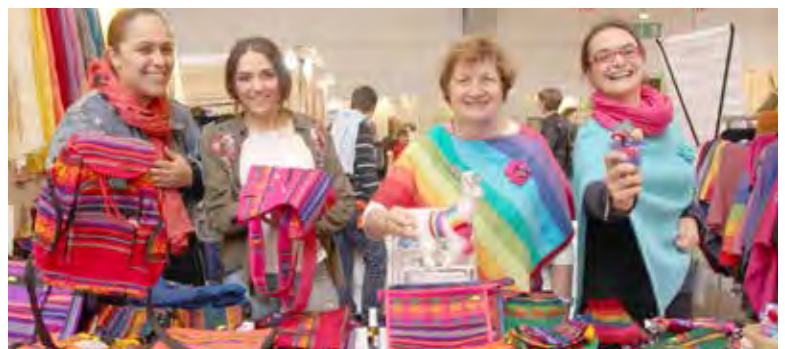
Voix Libres Strasbourg