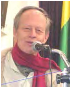
Reino - Voix Libres Blois et Voix Libres Finlande