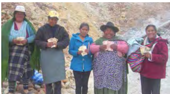
Elles ne sont plus paralysées de peur et respirent enfin!