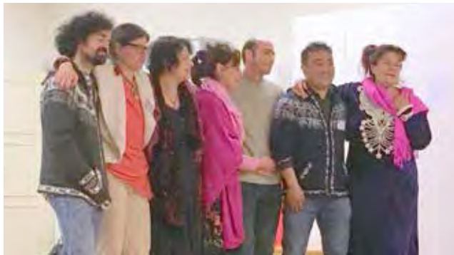
Voix Libres Genève